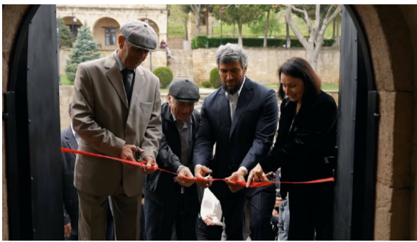
предметов, применявшихся горожанами в быту. Экспозиция историко-археологического музея «Древний Дербент» размещена на территории архитектурно-археологического комплекса «Цитадель Нарын-кала» на втором этаже Ханской канцелярии.

За период археологического исследования города и его округа в фондах музея-заповедника накоплено огромное количество различных предметов. Выявлены данные, подтверждающие существование в городе керамического производства, железообработки, камнерезного ремесла, обработки меди, стеклоделия и деревообработки. Бесконечно разнообразен круг